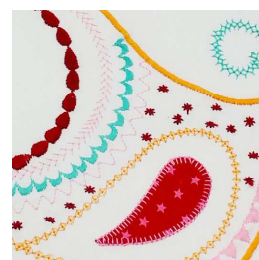
Numerosi punti decorativi