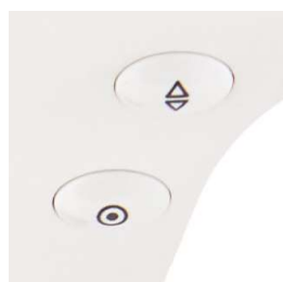
Ago alto/basso Fermatura Aut.

ACCESSORI IN DOTAZIONE: Piedino cerniera lampo, Piedino per asola, piedino sopraggitto, Piedino orlo invisibile, Piedino punto satin, Piedino per bottoni, Spoline, Ferma rocchetto (grande e piccolo), Feltrino ferma spola, Porta spola ausiliario, Cacciavite (grande e piccolo), Guida per quilting, Taglia asola/spazzolina, Set di aghi