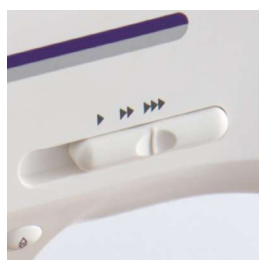
Regolazione della velocità